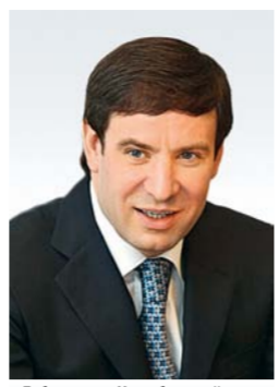
Губернатор Челябинской области Михаил Юревич

Шеленберг: ЗАО «ЮМЭК» постоянно развивается, создавая новые изделия. Наше бюро участвует в разработке этих изделий. Привлекает гибкость производства ЗАО «ЮМЭК». Это выражается в точности воспроизведения технологических процессов, в наличии испытательной базы.